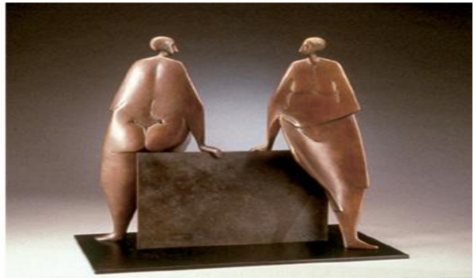
Carol Gold Friends 31h 29w 17d bronze ed/10 all rights reserved